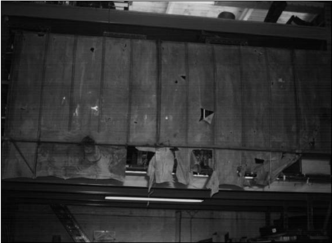
Une des ailes pendues dans l'atelier de la BAMRS. (Y. Duwelz)