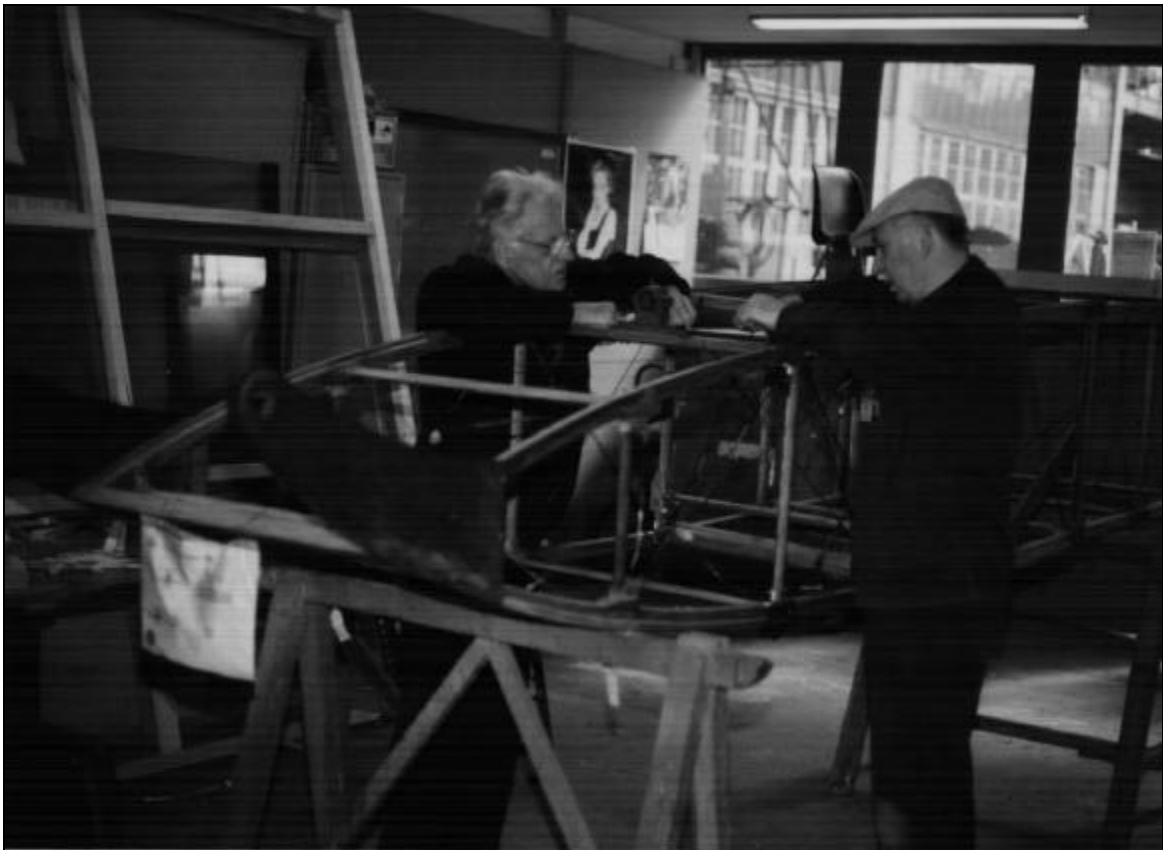
Les travaux sur la nacelle. (Y. Duwelz)